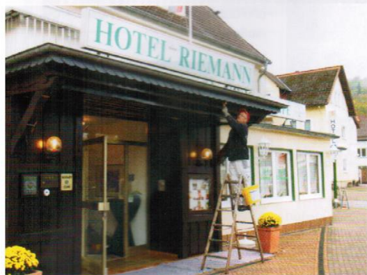
Neuer Fassadenanstrich 2015