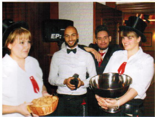
Silvester Serviceteam 2015